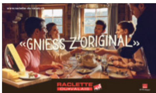
Publication de nombreuses annonces dans différents médias

Au printemps 2021 la pandémie de COVID-19 a empêché la mise en œuvre de certaines mesures promotionnelles (annulation d'événements, de dégustations, etc.). L'interprofession a donc adapté le budget marketing 2021 au fur et à mesure. Malgré un contexte plus compliqué à cause de cette situation exceptionnelle, de nombreux projets ont pu être menés à bien. Vous trouverez, ci-après, une présentation des actions marketing du premier semestre 2021.