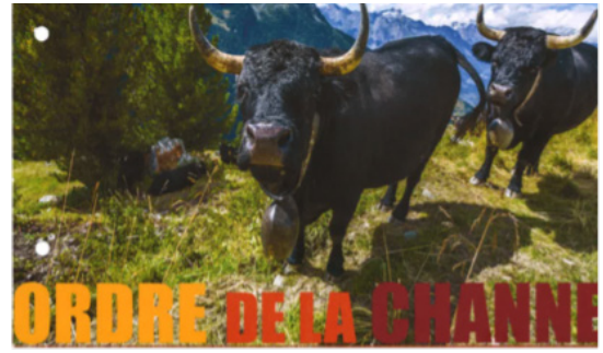
Campagnes de communication au niveau national et international, en coopération avec Switzerland Cheese Marketing AG et l'Association suisse des AOP-IGP