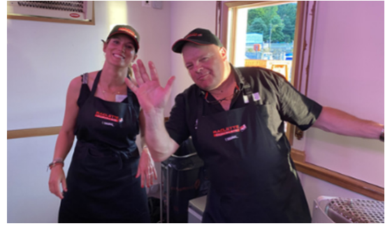
Participation à différents événements (quand c'était envisageable avec les consignes liées à la pandémie)