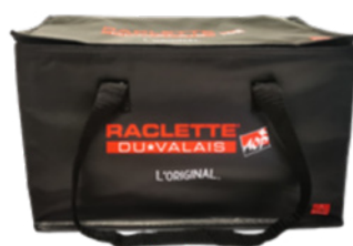
Glacière venant compléter la gamme des articles publicitaires