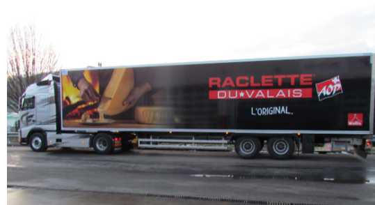
Décoration d'un semi-remorque rendant la marque Raclette du Valais AOP bien visible sur les routes suisses