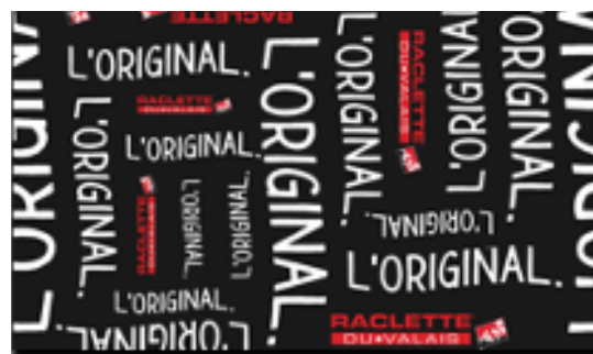
Création d'un beau papier d'emballage pour le fromage