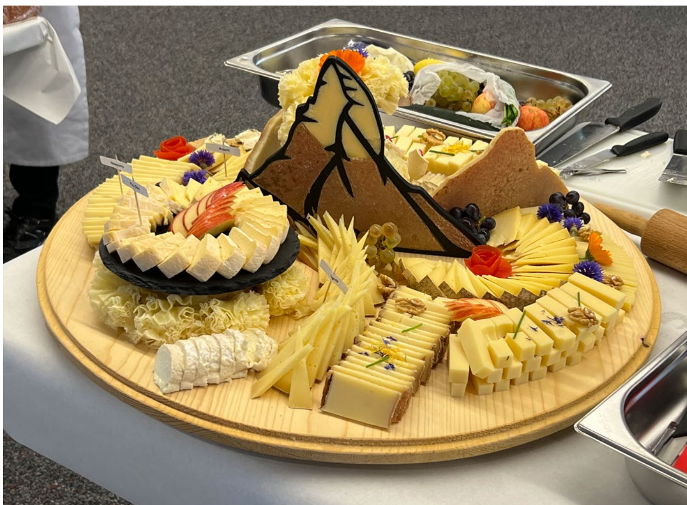
Plateau de dégustation, Swiss Cheese Awards 2024

Diplômes : Alpage de Tanay, Fromagerie de Liddes, Alpage d'Au d'Arbignon.