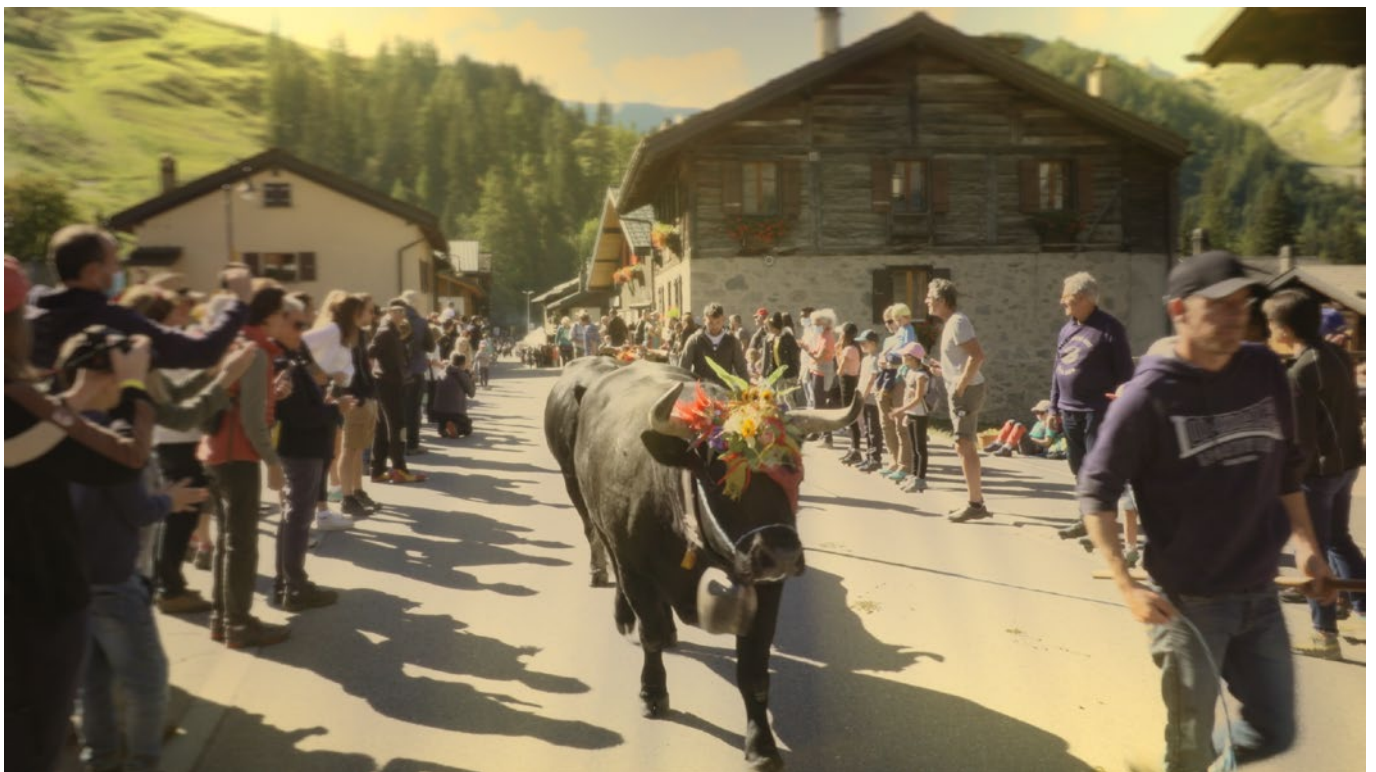
Film de présentation de Raclette du Valais AOP