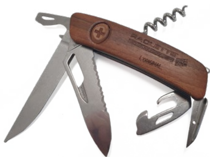
Nouveau couteau de poche de Raclette du Valais AOP avec lame pour racler

N'hésitez pas à en parler autour de vous.