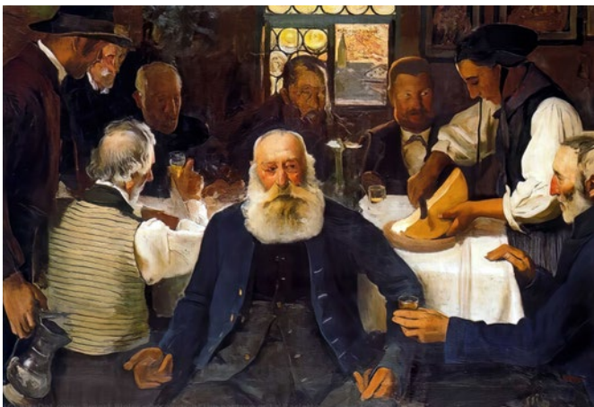
Huile sur toile du peintre Ernest Bieler, « La Raclette », 1903

Si la production de fromage en Valais est attestée depuis le 4 ème siècle avant Jésus-Christ c'est uniquement en 1574, il y a 450 ans, que Gaspar Ambüehl, un pharmacien de Sion, a décrit pour la première fois dans une lettre la manière de faire fondre le fromage en Valais - la recette de la raclette. Depuis, la raclette a été désignée « mets national valaisan » lors de l'exposition cantonale de Sion de 1909 et a également été démocratisée à travers toute la Suisse grâce à l'Expo nationale de 1964 de Lausanne.